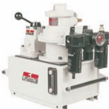
Bomba com Motor Pneumático (UHP)