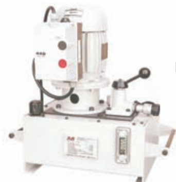
Bomba com Motor Elétrico (UHE)