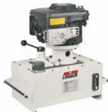
Bomba com Motor à Gasolina (UHG)